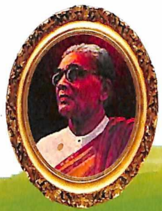
ప్రకాశం పంతులు గారు

రచయిత : శ్రీ వడ్డే శోభనాద్రిశ్వర రావు ఆం.ప్ర. మాజీ వ్యవసాయ శాఖామంత్రి