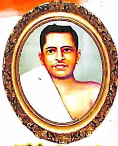
పోట్టి శ్రీరాములు గారు