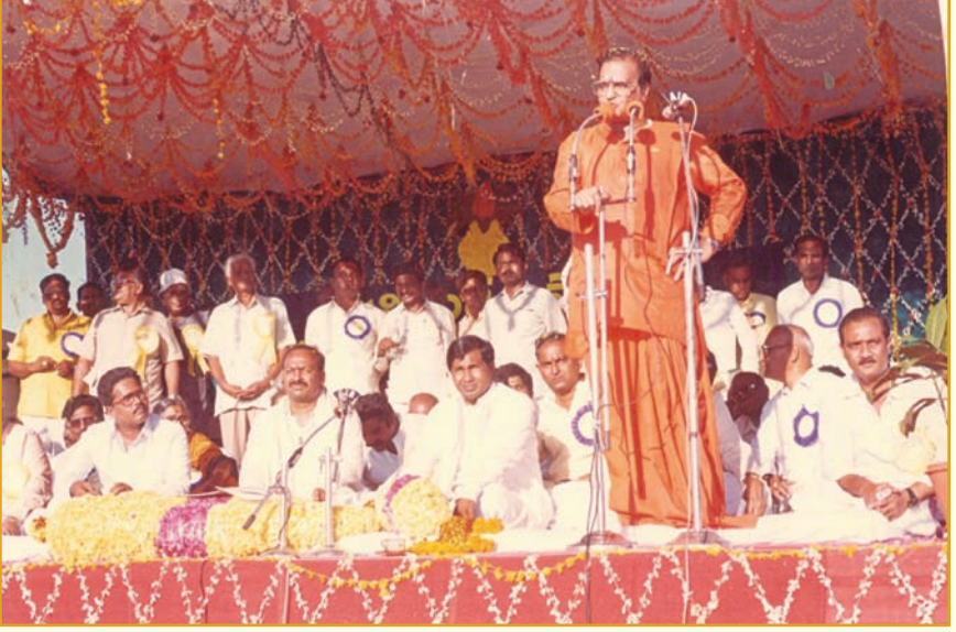
19-11-1988లో పులిచింతల వచ్చిన సందర్భంగా శ్రీ ఎన్.టి. రామారావుగారితో...