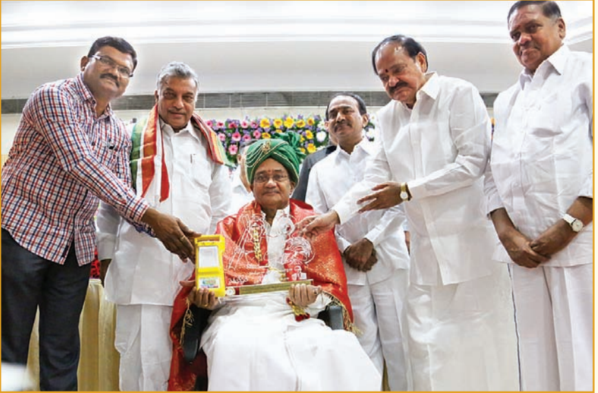
రైతుసేవ్ పురస్కారాలు 2015 సందర్భంగా గౌ. యం. వెంకయ్యనాయుడు గారి చేతులమీదుగా చిరు సత్కారం.