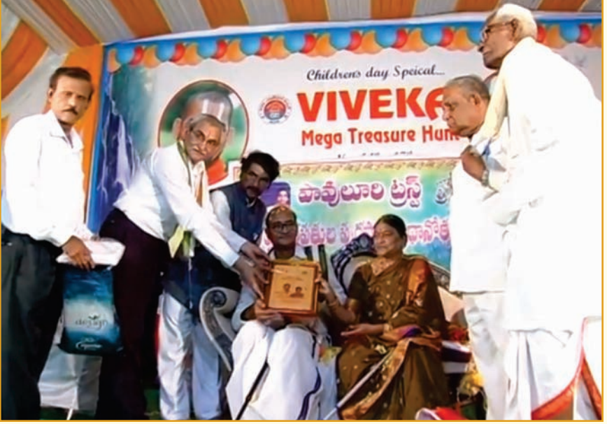
తెనాలిలో పావులూరి ట్రస్ట్ వారి “ఆదర్శ దంపతుల పురస్కారమును” అందుకుంటున్న సందర్భంగా....