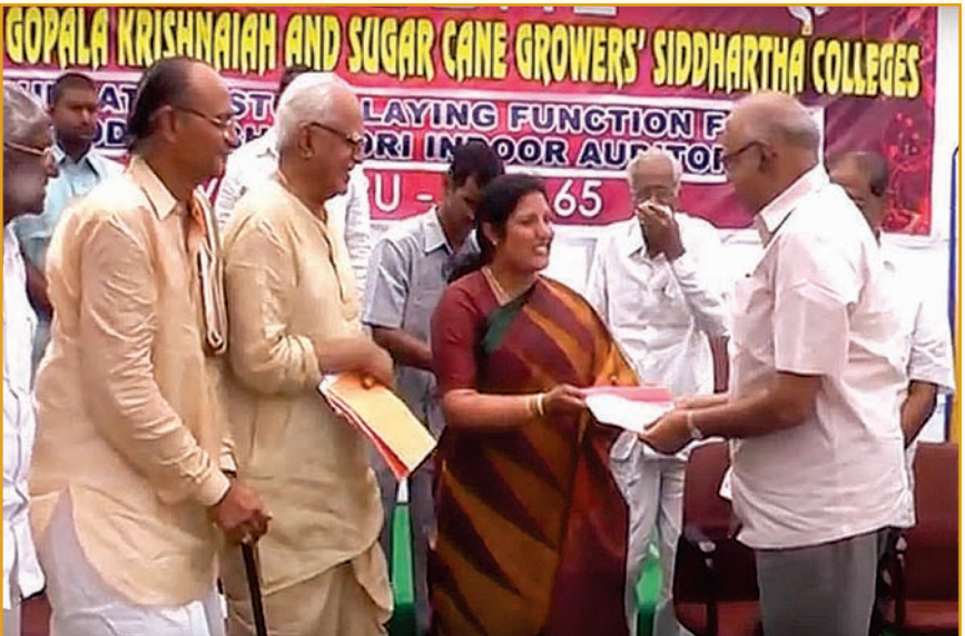
ఉయ్యూరు ఎ.జి.ఎస్.జి. సిద్ధార్థ కాలేజిలో వడ్డే శోభనాద్రి - యు.జి.సి. మల్టీపర్పస్ స్టేడియంనకు కేంద్ర మంత్రిని గౌ|| శ్రీమతి డి. పురంధేశ్వరిగారిచే శంకుస్థాపన సందర్భంగా....