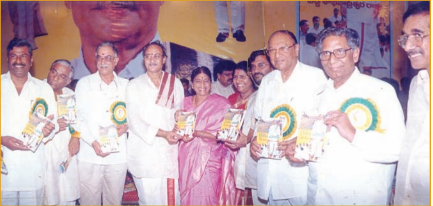
విజయవాడ ఆంధ్ర లయోల కళాశాల ఆడిటోరియం నందు 21-10-2003న 'రైతువాణి' పుస్తక ఆవిష్కరణ మరియు షష్టిపూర్తి మహోత్సవ సందర్భంగా...