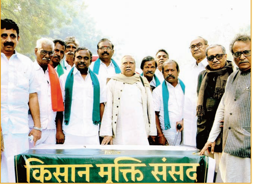
న్యూఢిల్లీలో 20, 21 నవంబర్ 2017లో కిసాన్ ముక్తి సంసద్ సందర్భంగా...