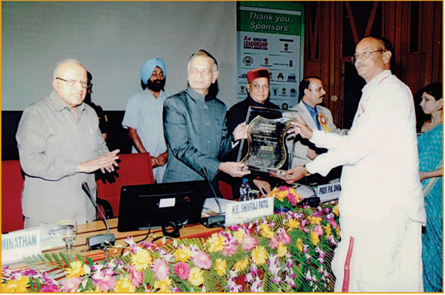
29 సెప్టెంబర్ 2019న న్యూఢిల్లీలో 'అగ్రికల్చర్ టుడే' ఆధ్వర్యంలో 'అగ్రికల్చర్ లీడర్షిప్ అవార్డ్-2019' అందుకున్న సందర్భంగా...