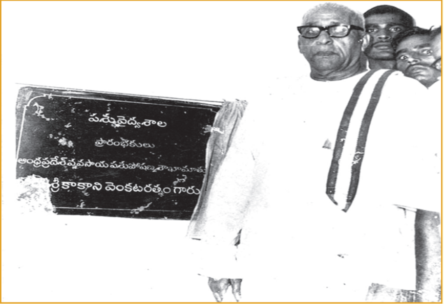
కాకాని వెంకటరత్నం గౌ|| వ్యవసాయ పశుసంవర్ధక శాఖామాయులుగారిచే మాతామహులు వెల్లంకి కుటుంబయ్య స్మారక పశువైద్యశాల భవన ప్రారంభం