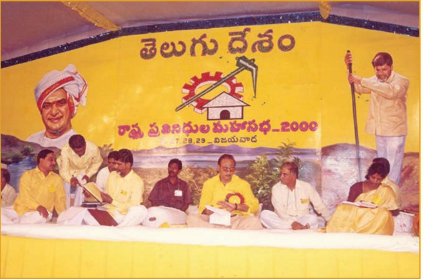
2000లో విజయవాడ సిద్ధార్థ కాలేజీలో తెలుగుదేశం మహాసభల సందర్భంగా...