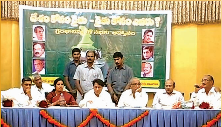
హైదరాబాద్ జూబ్లీహిల్స్లో "దేశం కోసం రైతు - రైతు కోసం ఎవరు" పుస్తకాన్ని ఆవిష్కరించిన కేంద్ర మంత్రులు గౌ. అజిత్ సింగ్ మరియు శ్రీమతి డి. పురంధేశ్వరి.